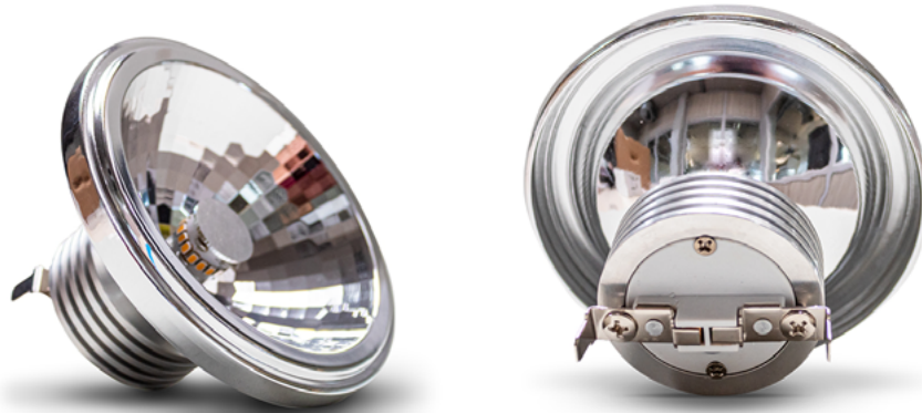
Detailaufnahme LED-Spot Detailed picture LED spot